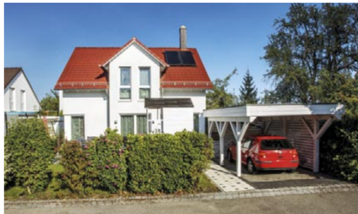
Der freistehende Carport bietet extra Stauraum und schirmt den Garten vor fremden Blicken ab.