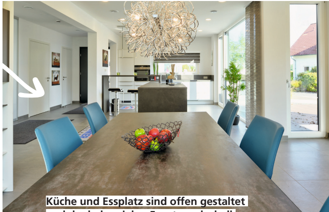
Küche und Essplatz sind offen gestaltet und dank der vielen Fenster sehr hell.